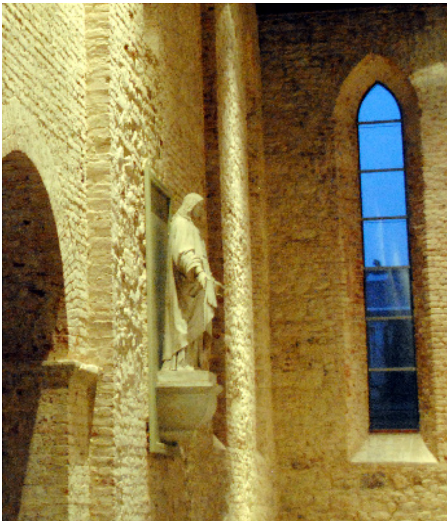
MARIENKIRCHE IN AKEN