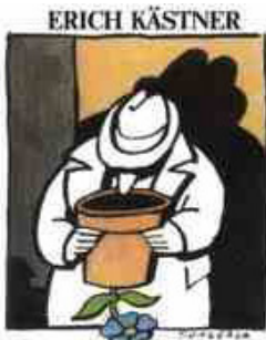
Ein Dichter gibt Auskunft

Sie führen wieder mal die alten Gespräche, denn das hält gesund. Die Fenster gähnen sanft und halten sich die Gardinen vor den Mund.